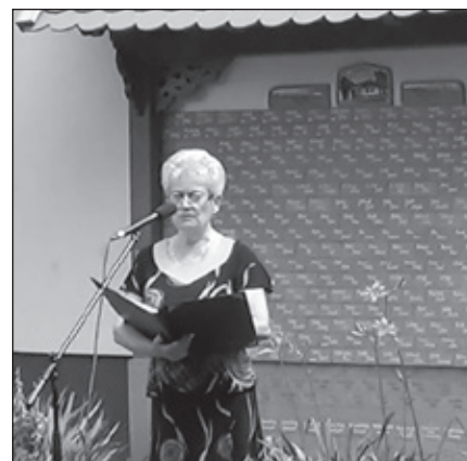
Znovuodhalený múr z roka 2016