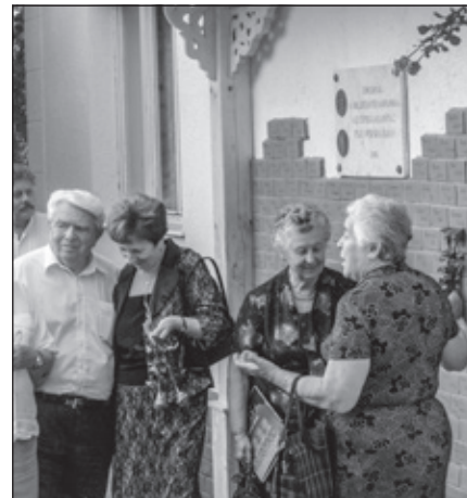
Odhalený pamätný múr z roka 2009