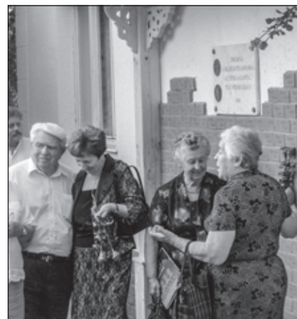
Odhalený pamätný múr z roka 2009