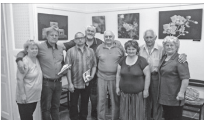
Spolu: darcovia a obdarené