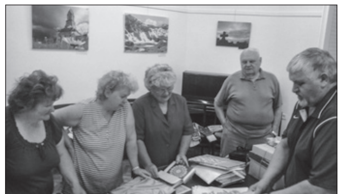
Pri odovzdaní daru členom Rozmarínu