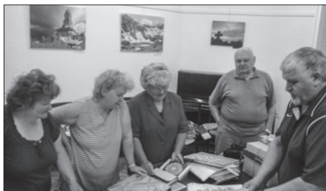
Pri odovzdaní daru členom Rozmarínu

24. júna, v rámci VII. ročníka Noci knižníc sa predstavujú slovenské inštitúcie (VÚSM, DSK, škola), slovenská menšinová samospráva a civilné organizácie (ČOS, OSMM) v Békešskej Čabe, literáti slovenského pôvodu (Závada Pál a Závada Péter), tanečníci (sloven-